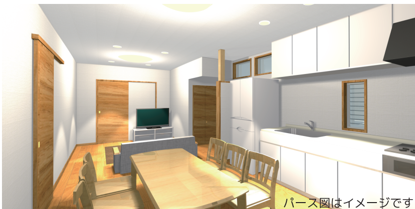
パース図はイメージです

築40年のお家は老朽化が目立ちはじめ、耐震強度に対する心配もあり、建物の補強も兼ねて全面改装をしたいとのご希望でした。もちろん断熱性能や新たな家族構成に合わせた間取り変更、水廻りも併せて見直したいとのご要望がございました。