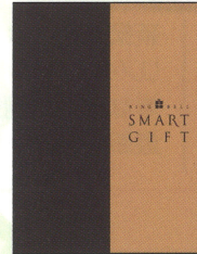
カタログギフト 【10,000円相当】

ご成約いただいたお客さまに、 選べるギフト10,000円相当+ Tポイント10,000ポイントをプレゼント