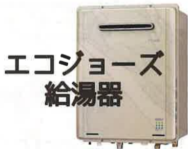
エコジョーズ 給湯器

給湯は エネルギー使用量の1/3 を占めているので 省エネ機器に変えるだけでエネルギー削減ができます。