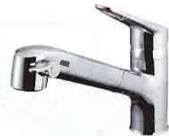
エコハンドル水栓